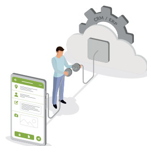
La integración de datos con plataformas y sistemas informáticos

Desde la plataforma web de Kizeo Forms puedes crear fácilmente tantos formularios como desees y, a continuación, rellenarlos desde la aplicación móvil , sin necesidad de tener acceso a Internet. De esta forma, puedes al instante generar informes y correos electrónicos, que se enviarán de forma automática a quien necesites.