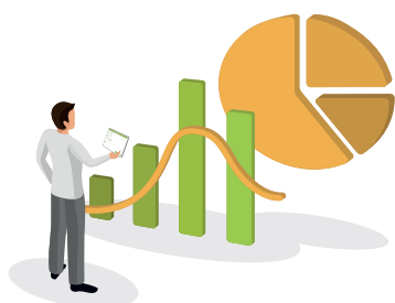
La generación de reportes, correos y análisis