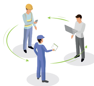
Los flujos de trabajo